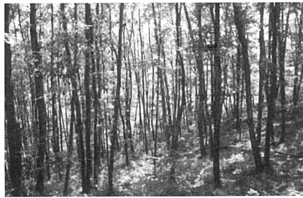
木もれ日のもれる雑木林

初めて学者村にいったのは二十八、九年前でした。たしか父の会社の同僚が二人同時に購入しまして、その方々は家を建てましたので、私の父は家を建てる事無くずっとその同僚の別荘に滞在するという事になっていました。