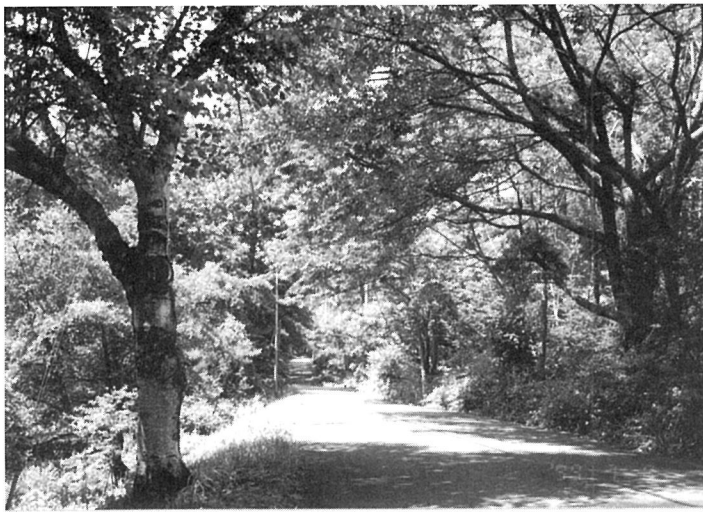
緑のトンネルを抜けて、そこを曲がってすぐだよ。ホラ！着いた。