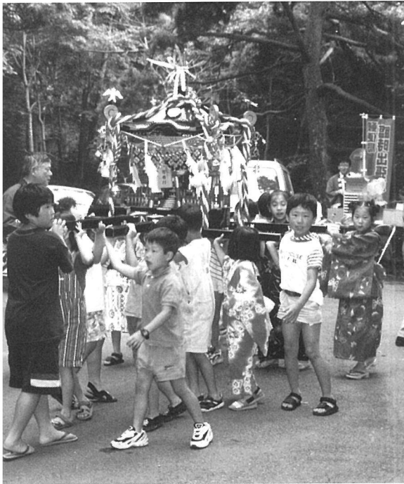
学者村祭りの子どもみこし