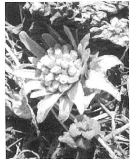
春を告げるフキノトウ