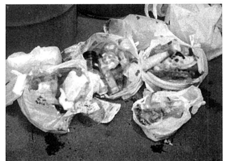
何でも構わず詰められたゴミ