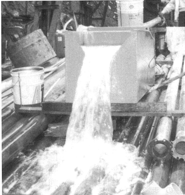
新しい井戸から豊富で良質な水が汲み上げられる