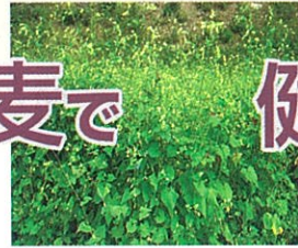
黄色いダツタンソバの花

生産組合事務局では「お茶以外には使えないかと思いましたが、プロの方の手に掛かると、八割・十割ソバがとてもおいしく色々な可能性があると分かりました」と今後に期待しています。また、すいとん・そばがき・クレープ・ケーキなどの新製品も販売され好評です。