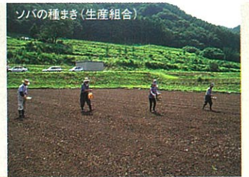
ソバの種まき(生産組合)

詳しい応募方法は町のホームページをご覧ください。 問合せ先／長和町役場 特産品開発係 ☎0268・88・2345