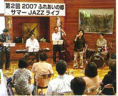
第2回 2007 ふれあいの郷サマーJAZZライブ

今夏8月15日1、500メートルの高原に位置する鷹山緑地等管理センター囲炉裏の間に、「2007第二回ふれあいの郷サマーJAZZライブ」が行われた。昨年を上回る72名の参加者で会場は埋まった。