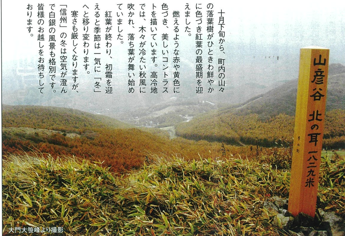
大門大笹峰より撮影

■発行と編集/ 長和町役場 建設課 TEL 0268-68-3111 FAX 0268-68-4011 平成19年12月発行