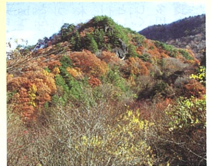
写真:本沢溪谷の秋