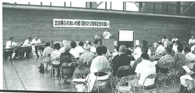
ふれあいの郷 開村20周年記念の集い

この集いは、ふれあいの郷別荘地が開村して20年を迎えるのを記念し、ふれあいの郷に別荘を所有する有志の方々が、住人間の更なる懇親や世代の交流を深めるため企画されました。