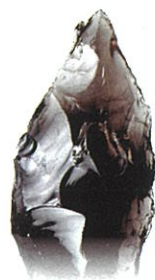
町の特別シンボル 「黒耀石」