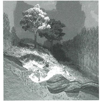
採掘の様子 (展示模型)

町内出土の縄文土器を展示縄文土器づくりができます。 窪城・大門保育所隣 月曜日休館／開館 9時～4時30分／TEL 0268-68-4339