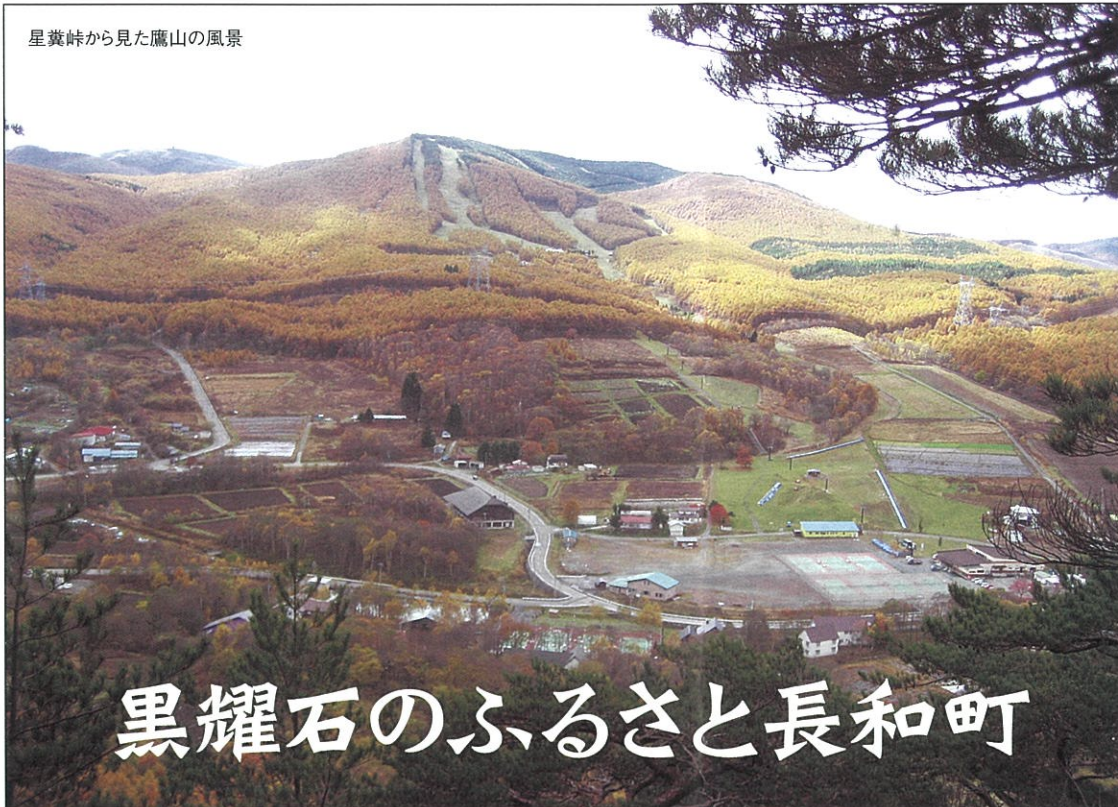
星葉峠から見た鷹山の風景