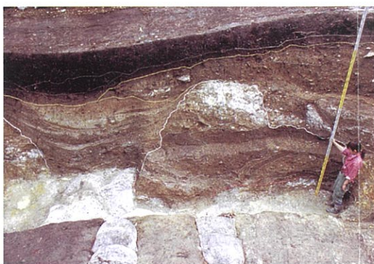
史跡公園内 星葉峠の黒耀石採掘跡 発掘調査の様子が見学できます。

人の動きや社会の仕組みを解明しようという研究が盛んです。地元でも、子ども達がふるさとの歴史を学ぶ授業で黒耀石について盛んに勉強しています。現在のような輸送手段もなかった時代に、なぜ、この貴重な生活資源が別け隔てなく全国に分配されていたのでしょうか。この理由について、子ども達は、祖先の心の優しさや、限られた資源を分かち合うことによって平和な社会を築く知恵を持っていたと感じているようです。皆さんはどうお考えでしょうか。町では、この黒耀石文化を世界遺産にという大きな夢を持っています。