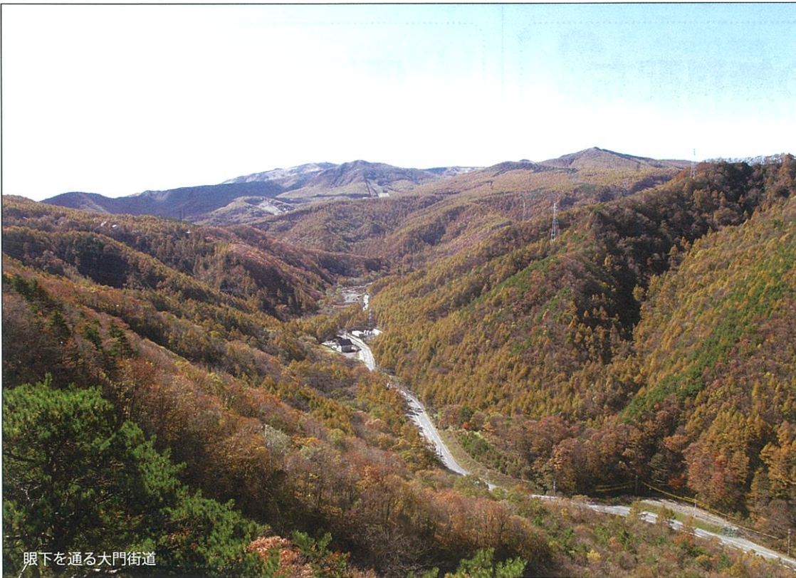
眼下を通る大門街道