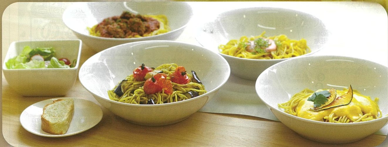
【レストラン緑の花そば館】 上:10割ダツタンそばもりそば 下:ダツタンそばパスタ

■発行と編集/ 長和町役場 建設水道課 TEL 0268-68-3111 FAX 0268-68-4011 平成27年12月発行