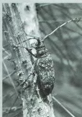
マツノマダラカミキリ

町宮別荘地の取り組みと対策 松くい虫被害は別荘全体の問題ではありますが、区画内の事は個別事業として対応をお願いしています。少額ではありますが別荘会計でも「松くい虫被害木伐採業務委託料」を計上させていただきます。これは主に、皆様のライフラインを守る為の松くい虫伐採に使わせていただいております。また災害に強い別荘地計画に併せ、針葉樹から広葉樹への自然転換、樹種転換を皆様にもお願いしております。大きくなりすぎた針葉樹を伐採し低木の広葉樹で構成した区画への転換を推奨しています。